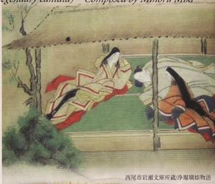
西尾市岩瀬文庫所蔵浄瑠璃姫物語